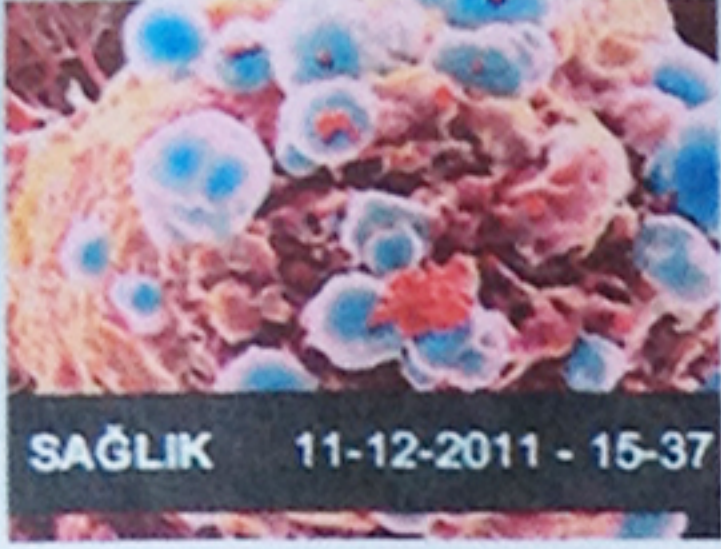
SAĞLIK 11-12-2011 - 15-37