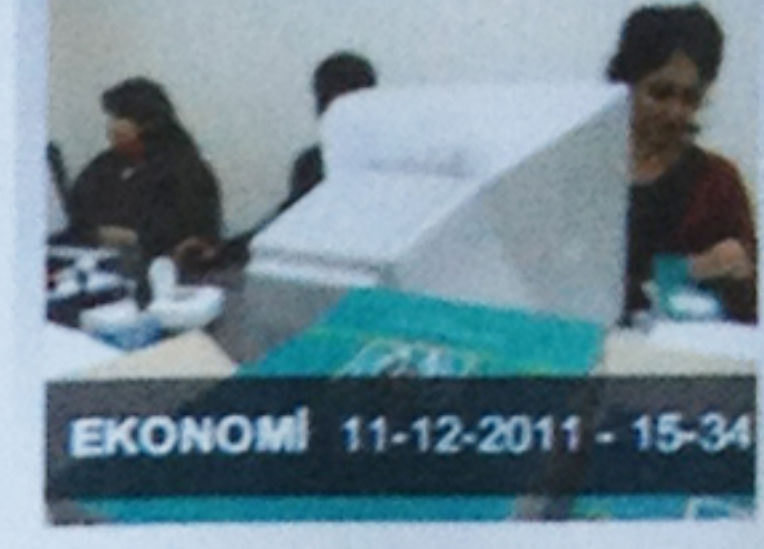
EKONOMİ 11-12-2011 - 15-34