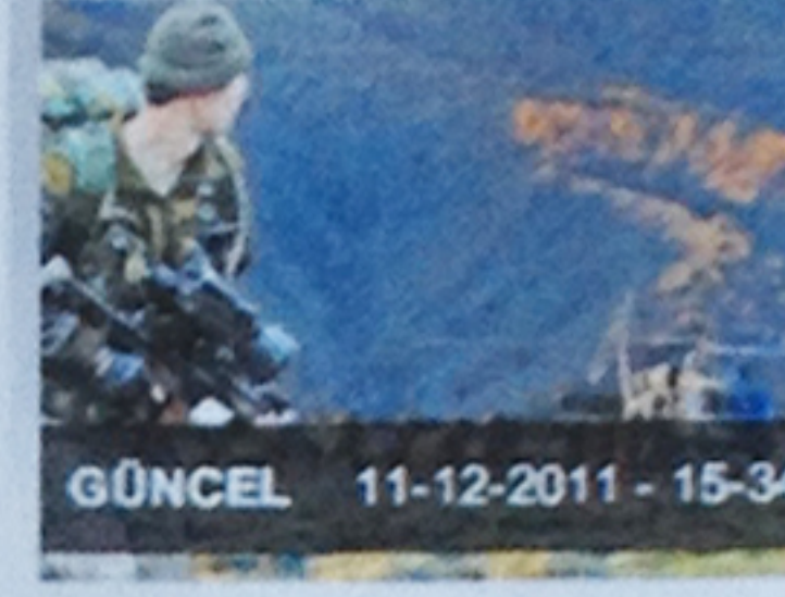
GÜNCEL 11-12-2011 - 15-34