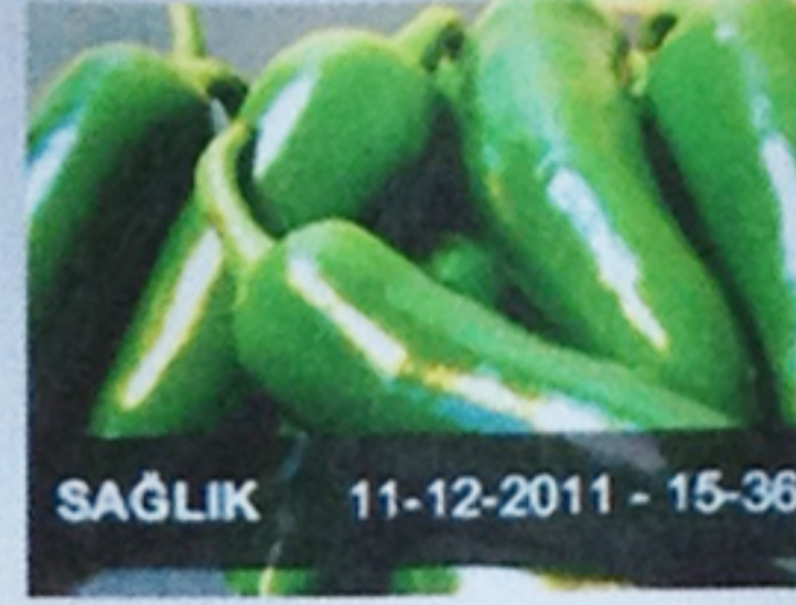
SAĞLIK 11-12-2011 - 15-36