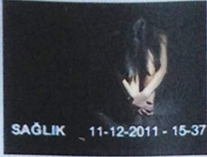
SAĞLIK 11-12-2011 - 15-37